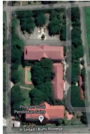
PASCASARJANA-UNTAD LUAS 1,6 Ha